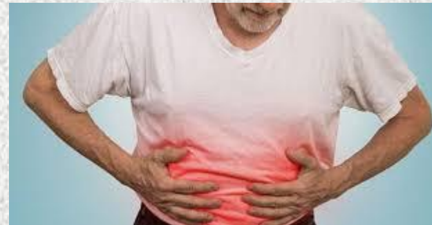
مراقبتهای بعد از عمل جراحی در منزل

درد مبهم شکم که از نزدیک ناف شروع می شود و تدریجاً به قسمت تحتانی راست شکم نقل مکان می کند. درد با حرکت، تنفس عمیق، سرفه، عطسه راه رفتن یا لمس بدتر می شود .